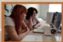
Онлайн-консультация skype: centr-reab