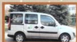
Социальное такси 48-31-77